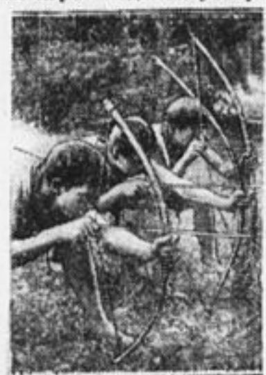
Стрелковый спорт. Лагерь 66 и 71 отр. Село Эльдишно.