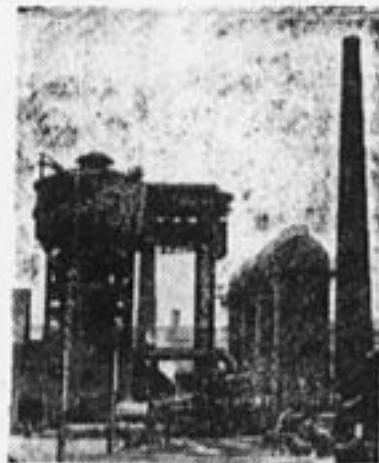
Доменный цех Златоустовского завода. Урал.

6-е августа по инициативе рабочих будет днем индустриализации. В этот день — церковный праздник «преображения господня» — рабочие Советского Союза