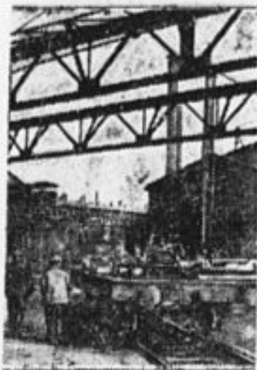
На судостроительной верфи в Сормове строится новый дизельный цех.