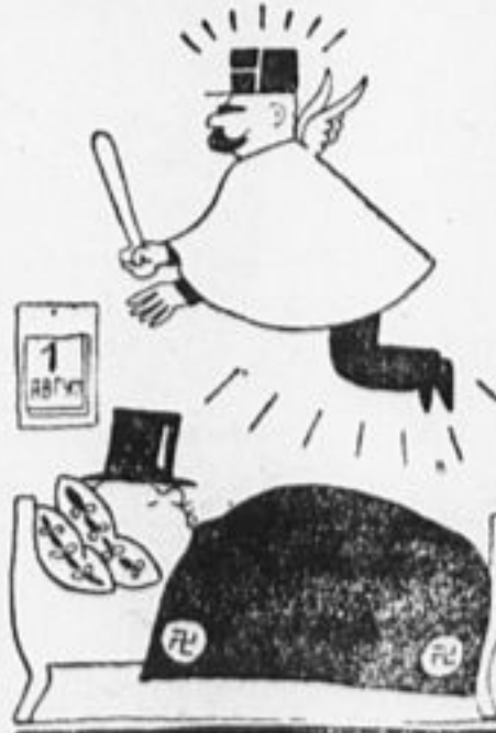
Спит буржуй и грезит он, что жандарм крылатый бережет буржуй сон от пролетариата.