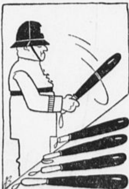
Макдональд, как и Чемберлен, для рабочих ничего не жалеет. Выбирает его полисмен дубинку потяжелее.