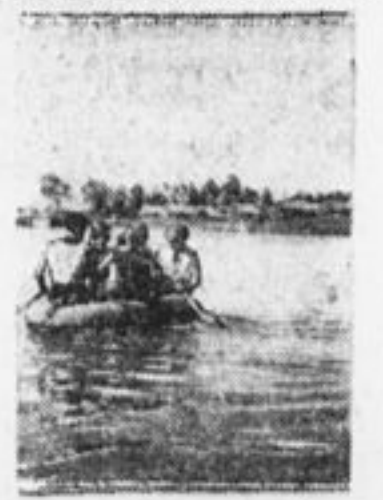
На резиновой лодке. Лагерь 66 и 76 отр. в с. Эльдишно.