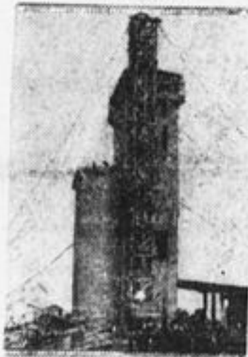
Совхоз «Гигант». К уборочной кампании закончена постройка элеватора емкостью 3.000 тонн зерна.