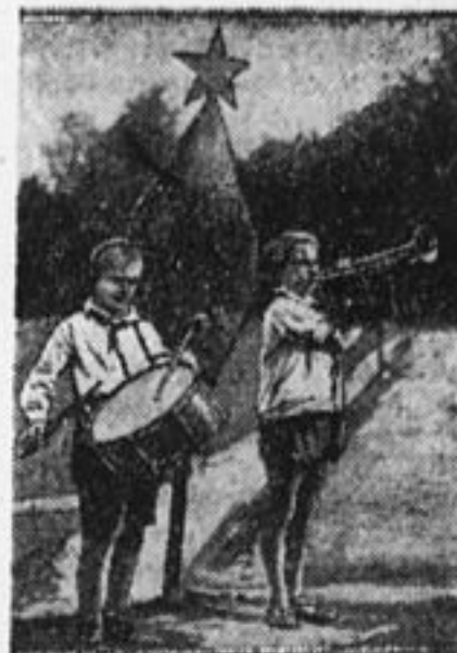
В лагере. Перед сбором.

8 июля, вечером, мы прошли в Певческие казармы в военноморской допризывный пункт. Эти допризывники уже накануне роспуска по деревням, и поэтому мы решили сделать маленький доклад о слете. Большое число допризывников оказались комсомольцами и нам