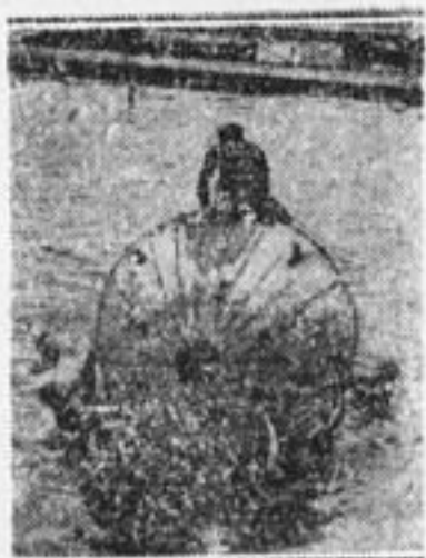
Новая игра «водяной уотербола».