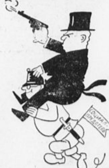
Буржуй и поход собирается. А чтоб он пешком не шел, везет его, старается, эсдековский осел.

Возьмем винтовки новые, на штык флажки и с песнею в стрелковые пойдем кружки. Если двинет армии страна моя, мы будем санитарями во всех боях.