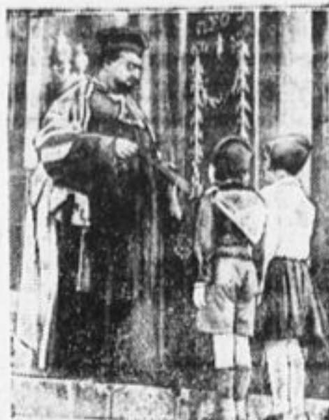
Раввин благословляет двух еврейских «балиллы» (члены дет. фашист. организации в Италии).